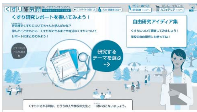
自由研究アイデア集 トップページ