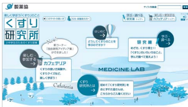
くすり研究所 トップページ