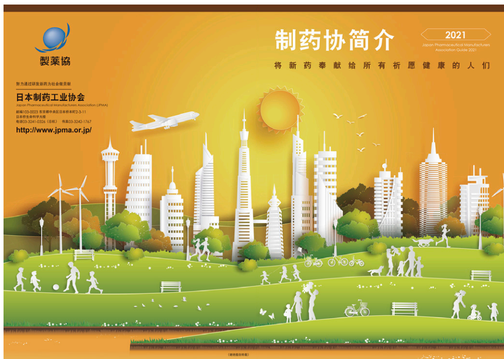
中国語版：表1表4(見開き)