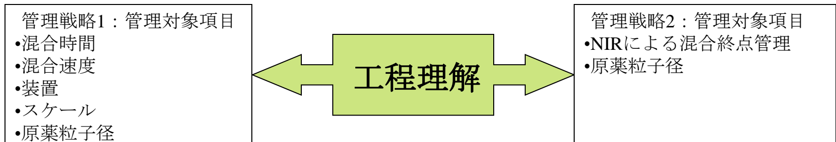
混合工程の管理戦略