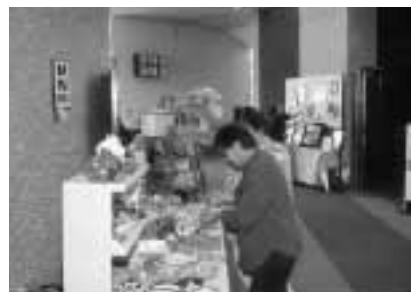
会場の準備もすべて手作り

小規模作業所は、働きたくても働けない仲間のための作業所として現在は「夢庵」と「笑む」の2カ所が開設されています。ここでは、患者さんが作った作品に自分自身が値段をつけて、売れた作品の代金は作者に返しています。また、絵手紙、アロマテラピー、枯葉絵、パソコンなどの趣味の講座も充実。仲間が集まって楽しみながら、病気や人生相談なども行っています。