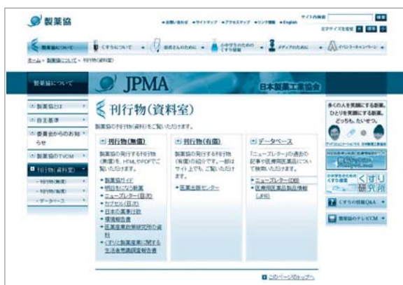
製薬協ウェブサイト「刊行物（資料室）」 http://www.jpma.or.jp/about/issue/

製薬協ウェブサイトは、「製薬協」もしくは「JPMA」で検索してください。医薬品・製薬産業に関するいろいろなコンテンツを掲載しています。