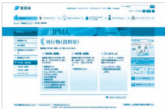
製薬協ウェブサイト「刊行物(資料室)」 http://www.jpma.or.jp/about/issue/

製薬協ウェブサイトは、「製薬協」もしくは「JPMA」で検索してください。医薬品・製薬産業に関するいろいろなコンテンツを掲載しています。